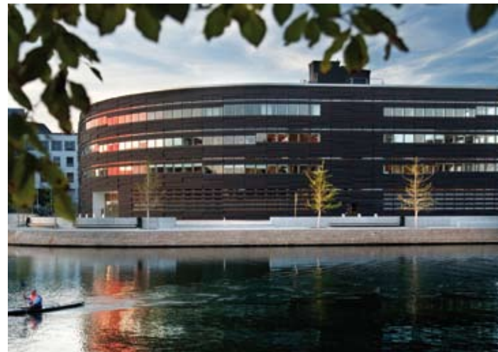
Nya hovrättsbyggnaden i Malmö.