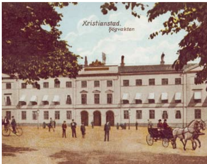
Stora Kronohuset vid Stora Torg i Kristianstad. Byggnaden uppfördes för hovrätten och för Wendes Artilleriregemente. I fasadens attika står den latinska devisen "Legibus et armis" – åt lagar och vapen. Hovrätten hade säte i huset år 1840-1917. Vykort från 1910-talet.

År 1766 Under 1700-talets upplysnings- och frihetstid betonades den enskilda medborgarens rättigheter och friheter. Medborgarens möjlighet att förstå och förutse lagens verkningar var en viktig del av detta. Genom 1766 års tryckfrihetsförordning infördes principen att allmänna handlingar är tillgängliga för medborgarna, en grundpelare i svensk rätt.