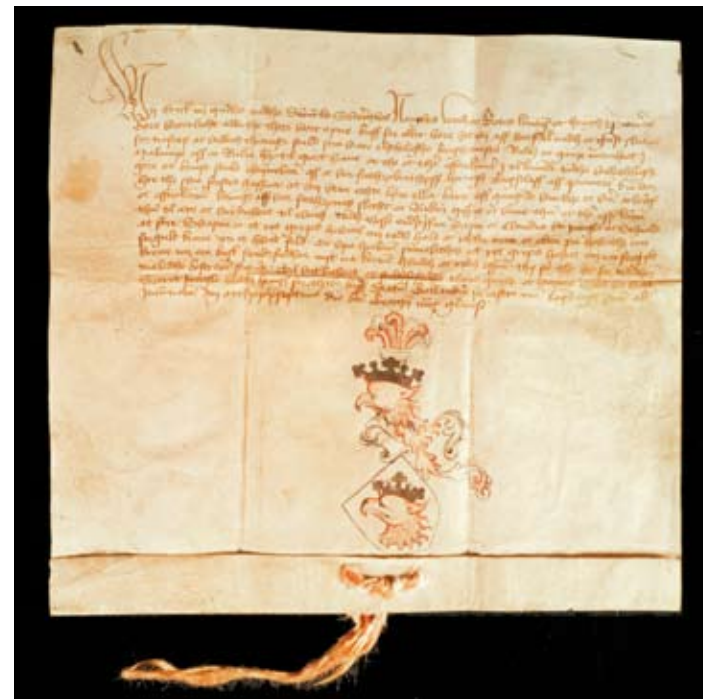
Malmö stads vapenbrev

År 1215 Sedvanerätten nedtecknades i Skånelagen omkring år 1215. Lagen, som gällde för bland annat Skåne och Blekinge, handlade framför allt om familjerätt, arvsrätt, fastighetsrätt och straffrätt. Texter från Skånelagen har använts som dekoration i flera av salarna i den nya hovrättsbyggnaden.